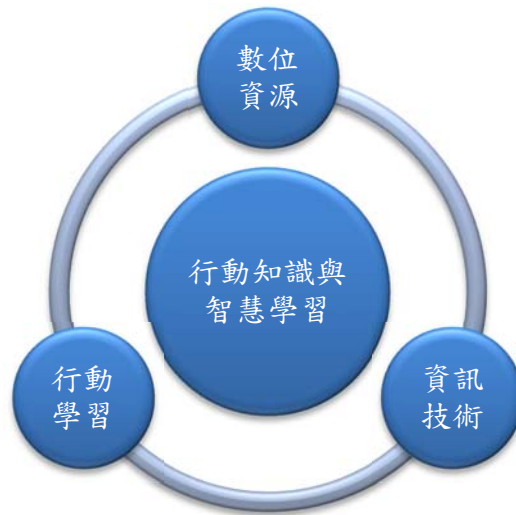
系統管理之三項建設